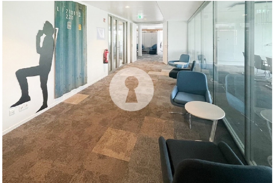
Hochwertiger Ausbau und gekühlte Büros