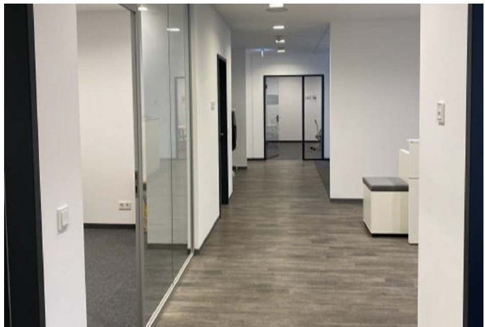
Innenansicht 1 Haus 4, 1 OG