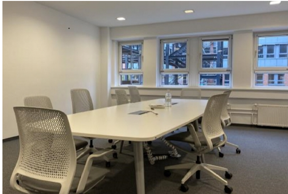
Innenansicht 4 Haus 4, 1 OG