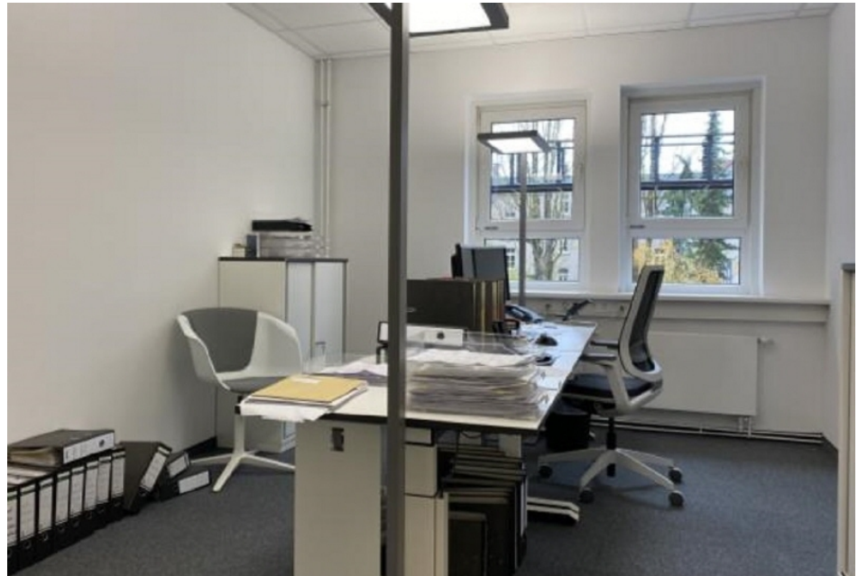
Innenansicht 2 Haus 4, 1 OG