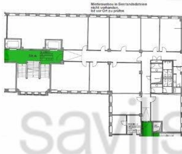
Altstädter Straße 6_4 OG 520,77 m 2