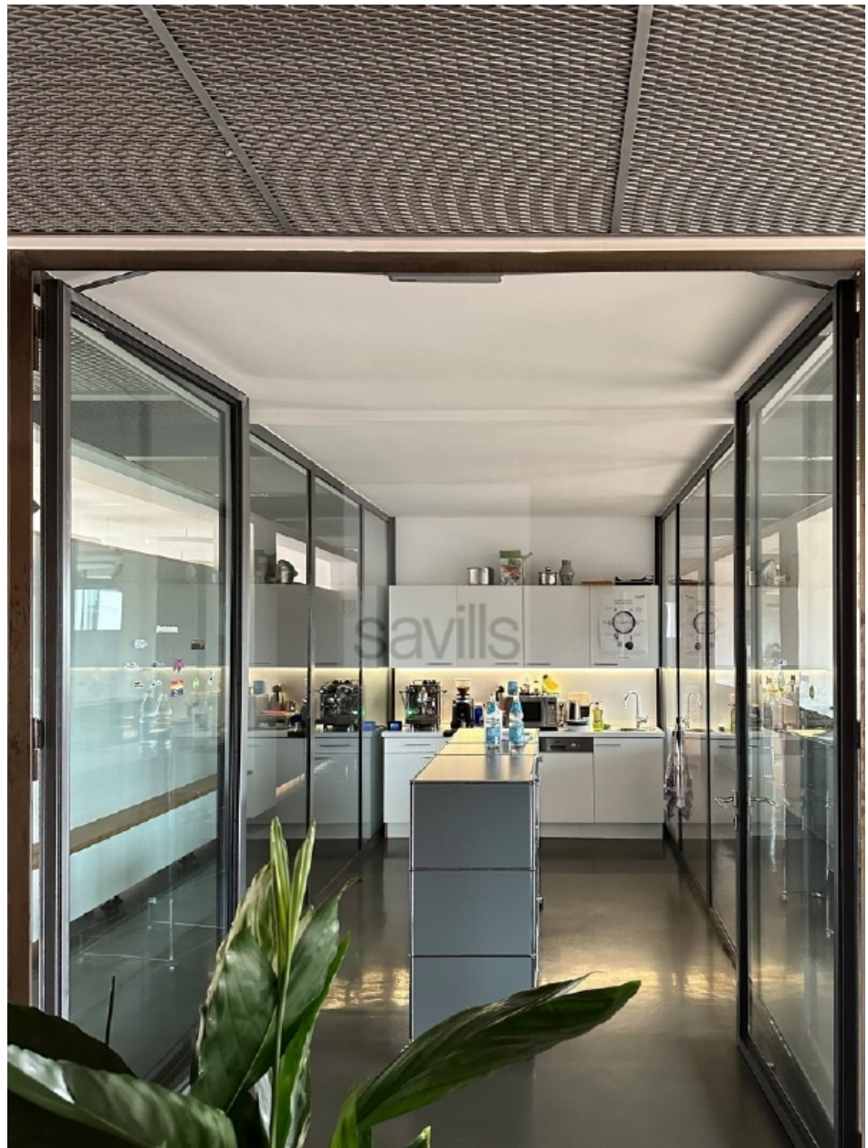
Große Elbstraße 14, Küche