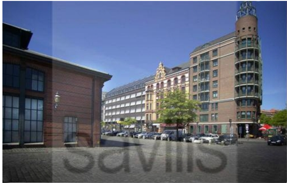
Blick vom Fischmarkt