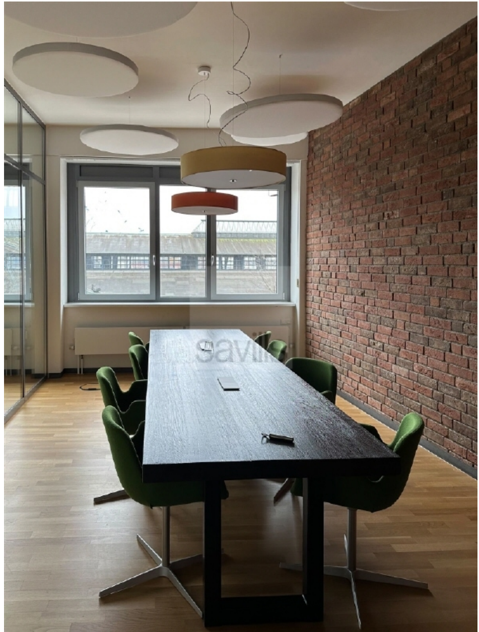
Große Elbstraße 14, Besprechungsraum