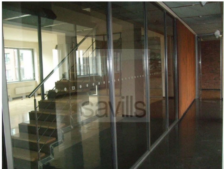
Treppenaufgang und Glaselemente