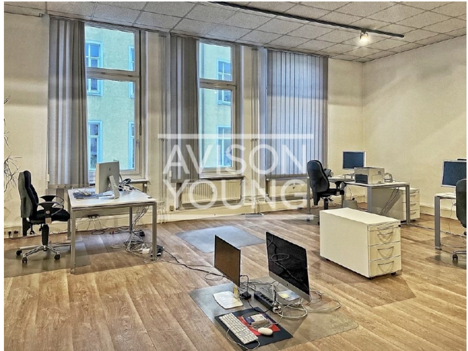
Haus 5a 2 Obergeschoss mit ca 159,00 m 2