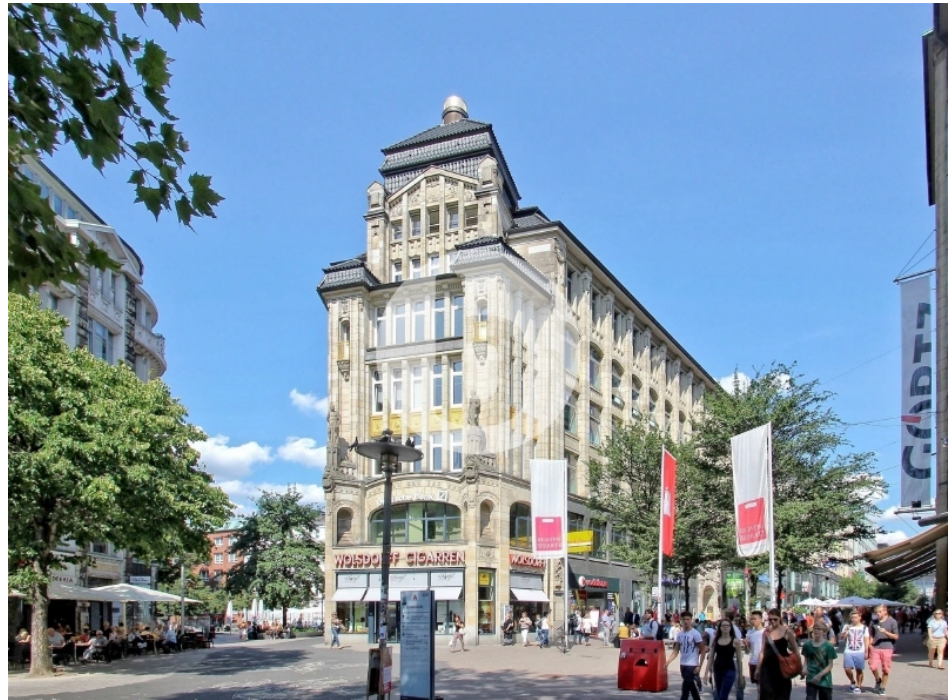
Seeburg Spitaler Straße Altstadt Hamburg Bürogebäude Außenansicht