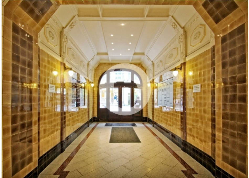
Seeburg Spitaler Straße Altstadt Hamburg Bürogebäude Innenansicht