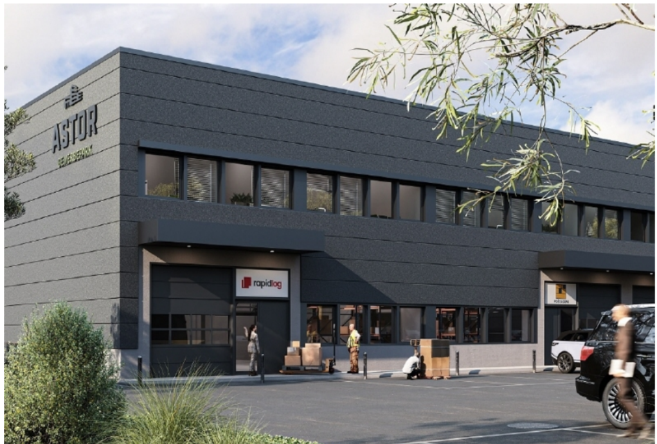
Office Building Ansicht, visualisiert