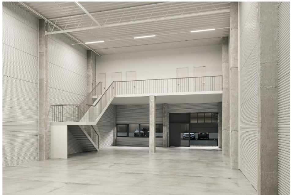
Lagerhalle Ansicht 1, visualisiert