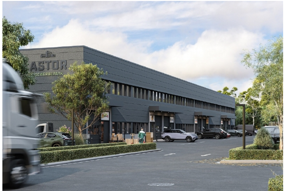
Office Building Ansicht 2 visualisiert