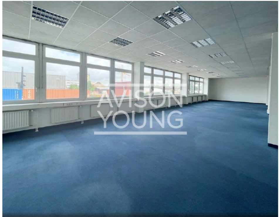
Innenansicht, 5 OG