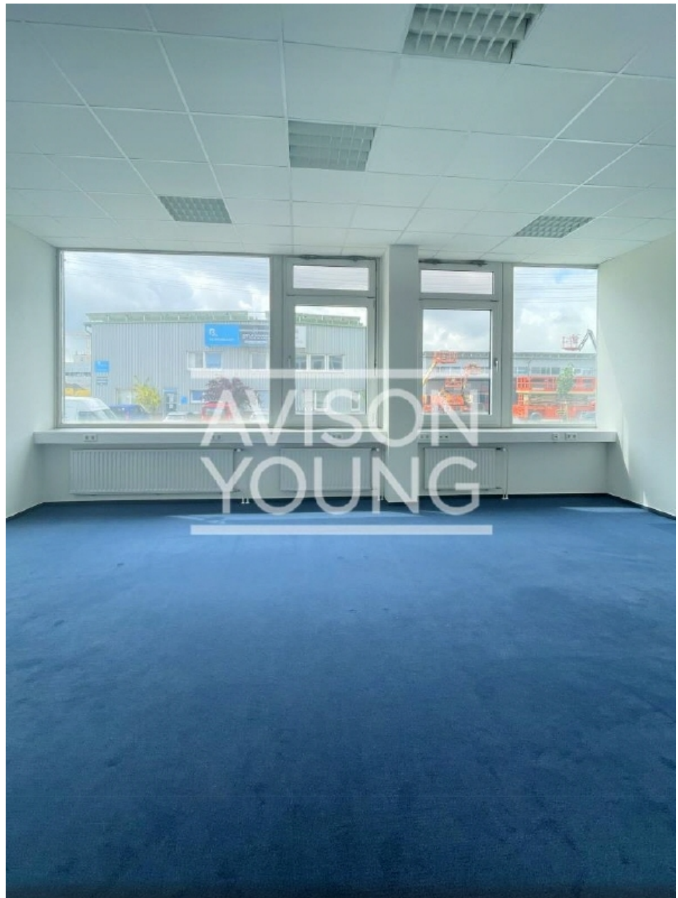
Innenansicht, 1 OG