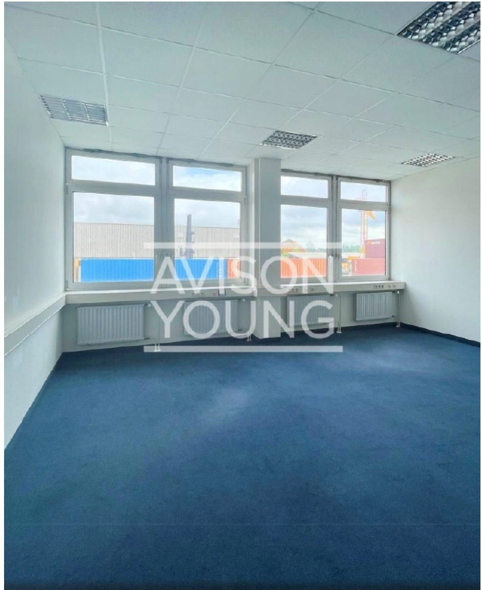
Innenansicht 5 OG